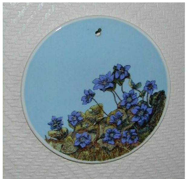
Et eksempel fra serien ”Markblomster”