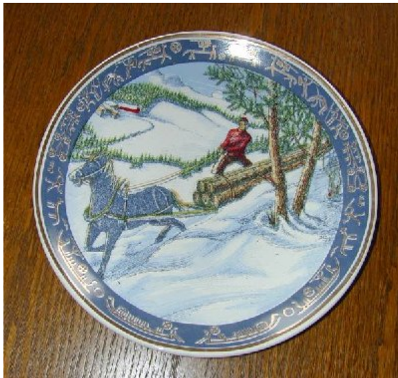
Fra serien "Norge på langs"