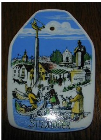
Stedsmotiv fra Stavanger