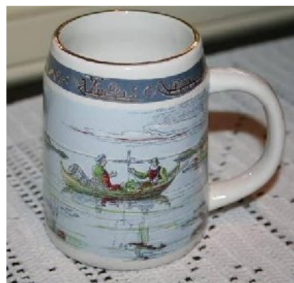
Mange av Hinnas motiver finnes også på krus.