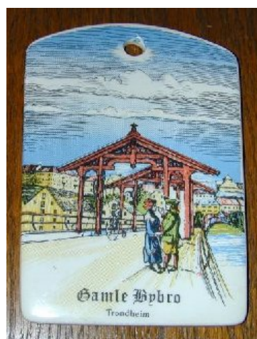
Stedsmotiv fra Trondheim