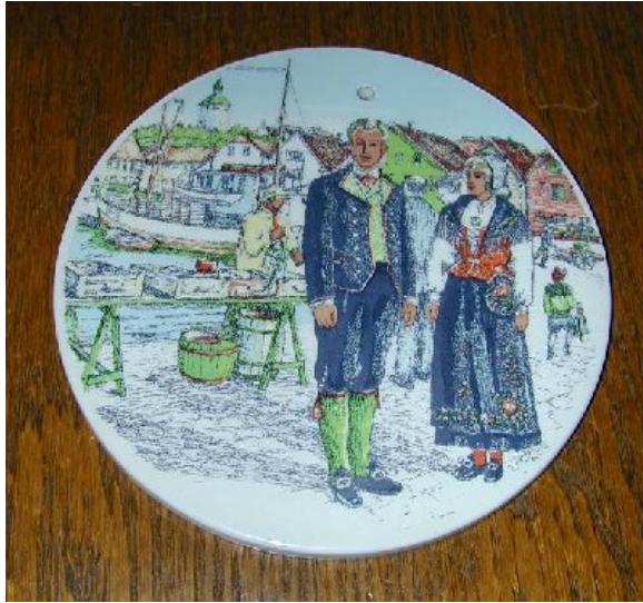
"Norske Bunader" – her et eksempel med motiv fra Vågen i Stavanger