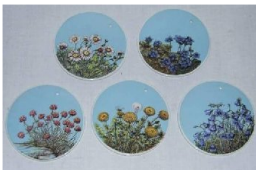
Fem motiver fra "Markblomst-serien"