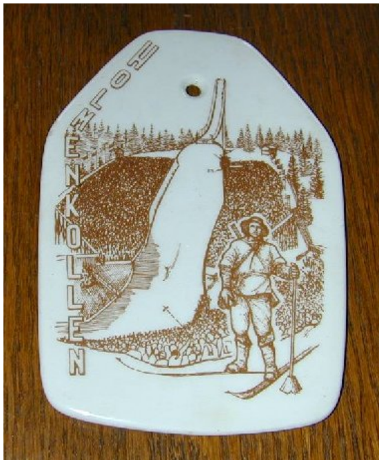
Stedssuvenir i ensfarget trykk