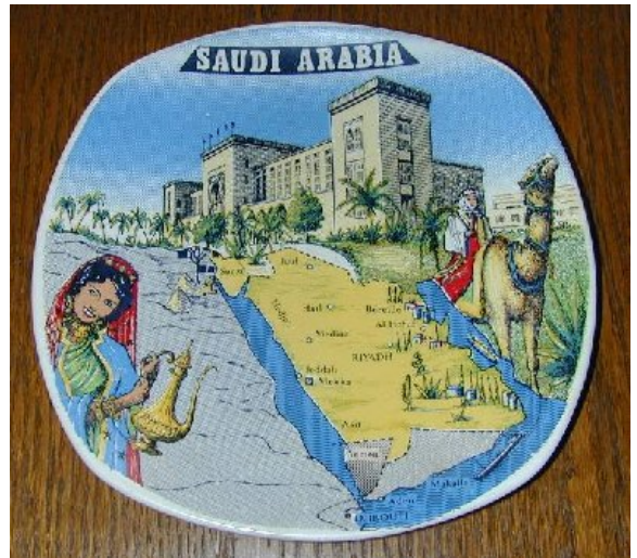
Suvenir for fjerne himmelstrøk.