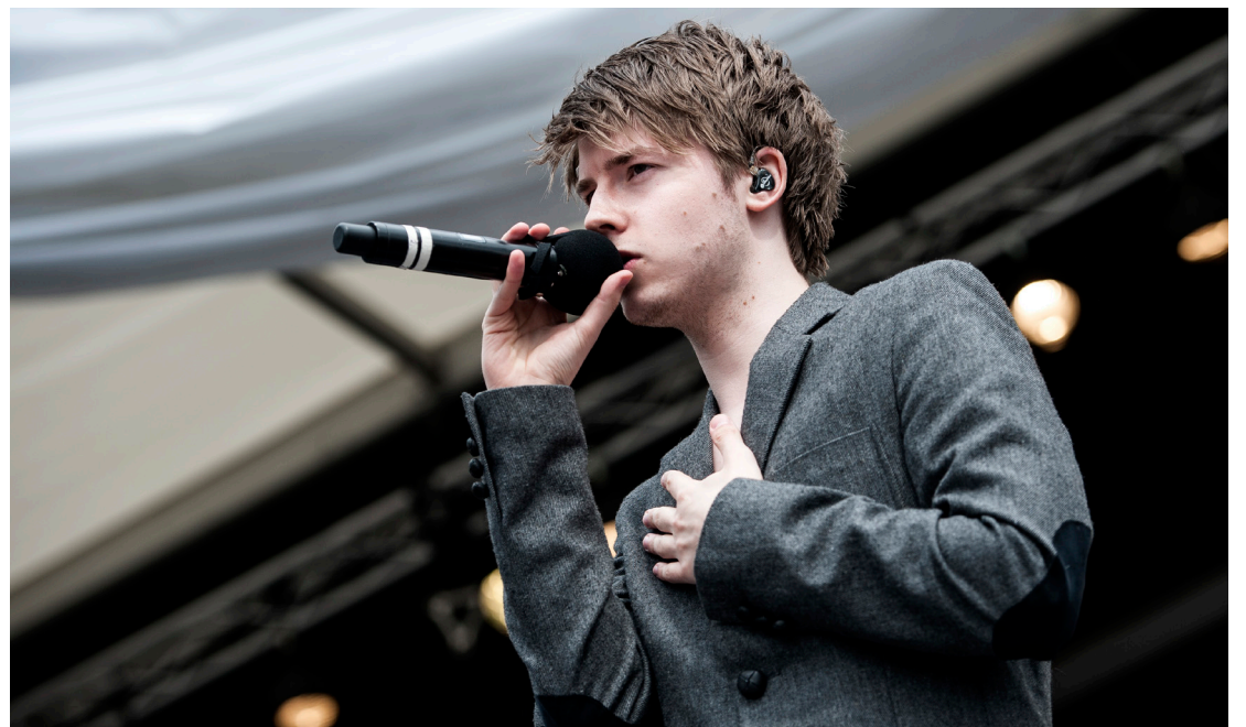
Lido har teamet opp med Kork, og har allerede solgt til fullt hus.