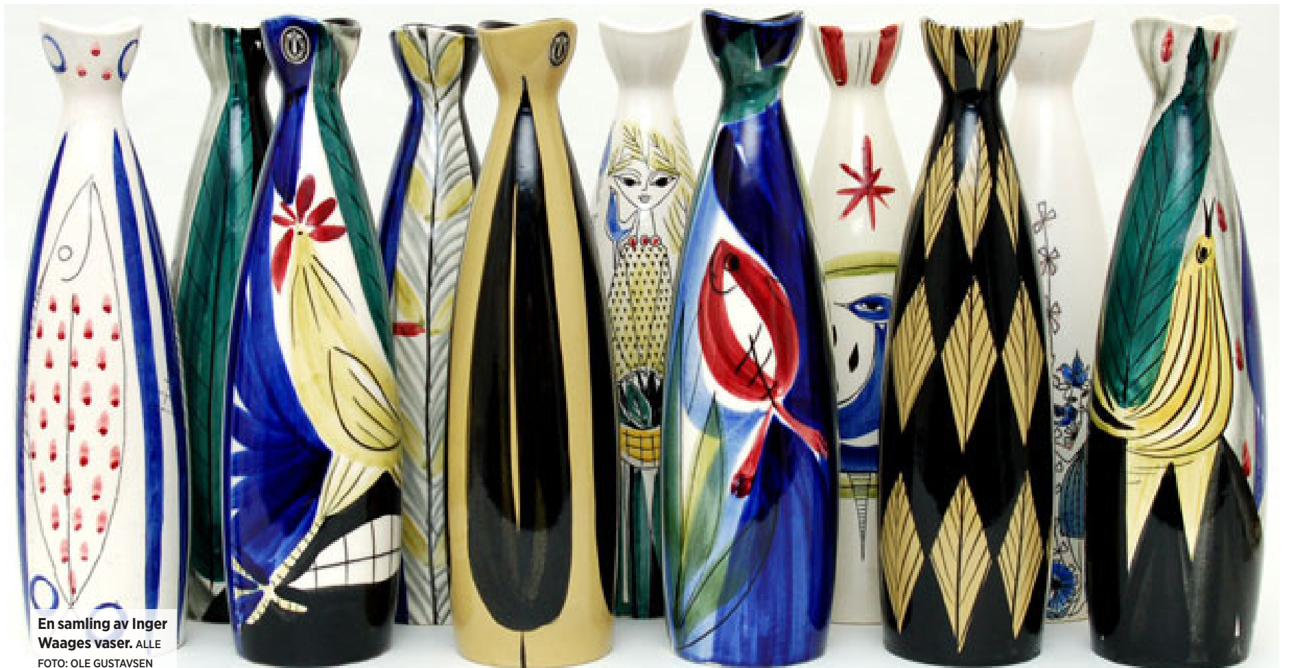
En samling av Inger Waages vaser.