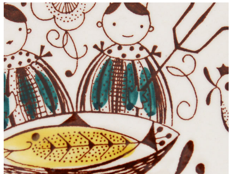
Mesterkokken eller «Chef» i den ildfaste serien «Flamingo».